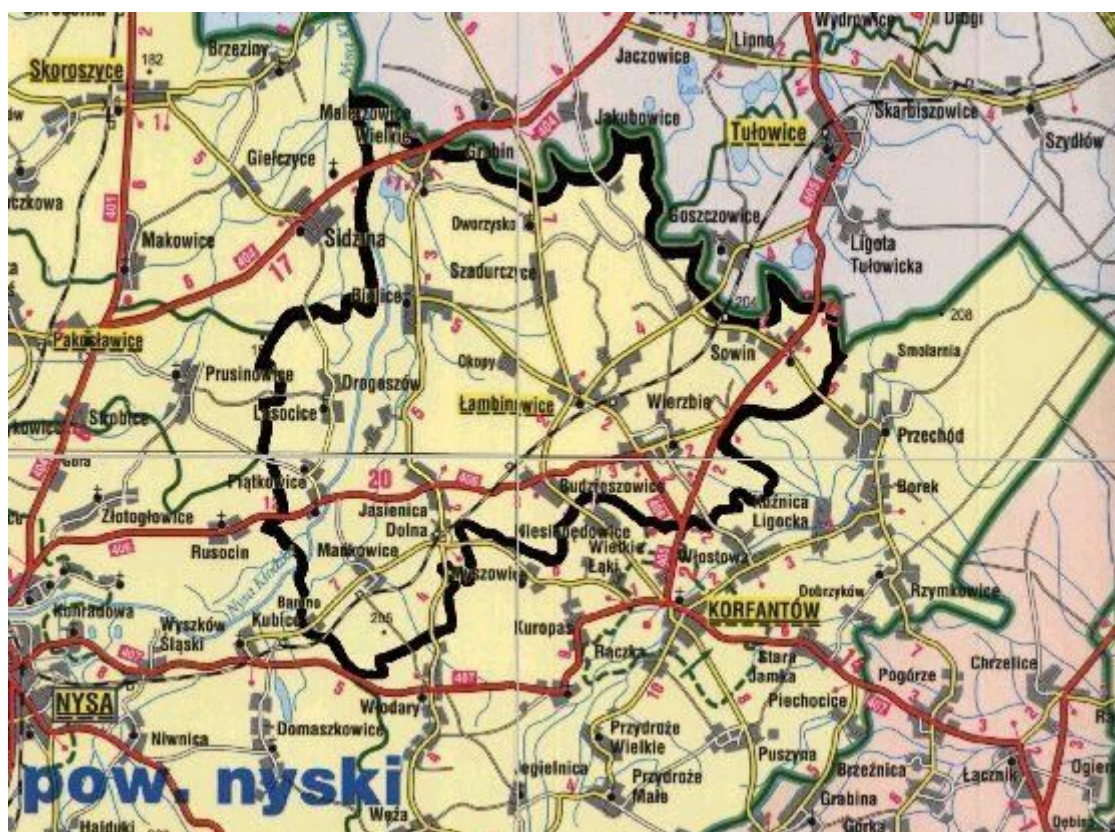
Mapa Gminy Łambinowice